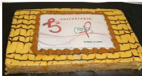
Como en todo cumpleaños o aniversario no podía faltar la torta, en esta ocasión de panqueque, para celebrar los 5 años de trabajo en la Prevención Social del VIH/SIDA.