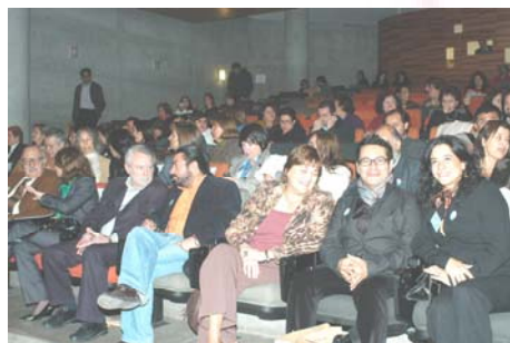
Los asistentes a la conmemoración del 5to aniversario del CRIAPS participaron atentamente a las actividades programadas en el Auditorio de la Biblioteca de Santiago