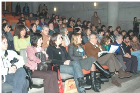
Muchos amigos y amigas acompañaron al CRIAPS en su celebración. Atentos y atentas a la presentación de la Metodología del Debate Teatro como herramienta educativa para colegios. Y expectantes ante la magistral exposición del Dr. Horacio Croxatto sobre sexualidad e información.