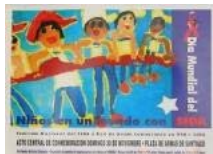
N°016 63,8 X 45,8 cm