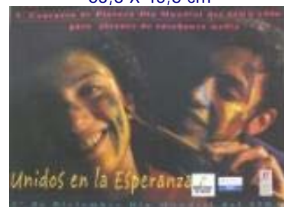
N°027 79,5 X 51 cm