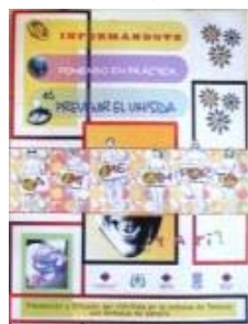
N°017 37,7 X 49,8 cm.