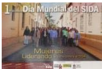
N°019 54 X 36 cm.