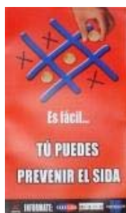
N°006 30 X 50,3 cm.

Afiches termolaminados producidos por el CRIAPS, CONASIDA, MINSAL, y otras organizaciones nacionales e internacionales, estos presentan un contenido que permite ser usado en el tiempo como elemento de apoyo educativo o informativo en la prevención del VIH/SIDA. Esta colección es posible prestarla a organizaciones o instituciones en calidad de exposición gráfica para actividades educativas. Aquí algunos afiches de la colección: