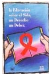
N°072 40 X 60 cm