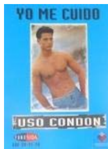
N°005 33 X 43 cm.