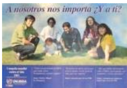
N°010 37 X 53,5 cm